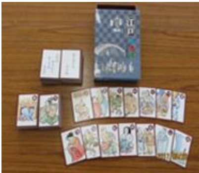
⑯江戸いろはかるた