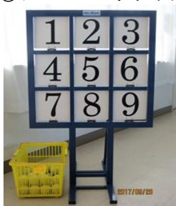
②⑧ナンバーストライク