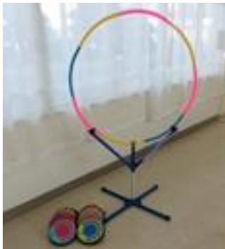
⑦フープディスゲッター