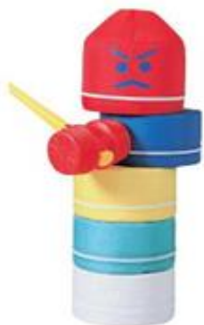
②⑨大型だるま落とし