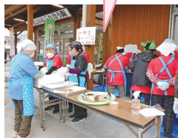
地域行事への参加 (ボランティア活動)