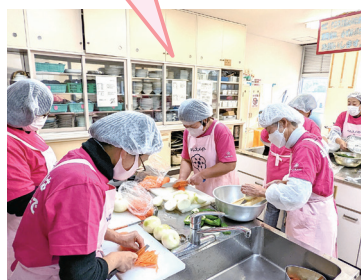
見守り活動 (ふれあい型給食サービス)