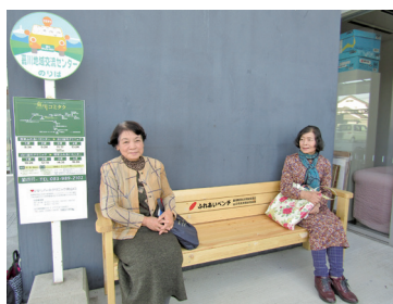
ふれあいベンチの設置 (みんなに優しいまちづくり)