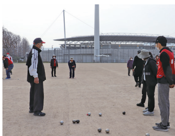
ふれあい交流 (ペタンク交流大会)