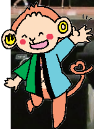
タスクン (山口市社協イメージキャラクター)