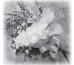
※画像は見本です。 大きさは10cm×10cm程度