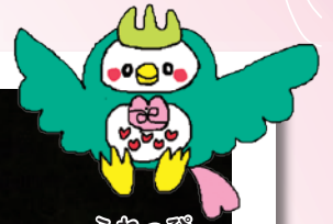
ふれっぴー (山口市社協イメージキャラクター)