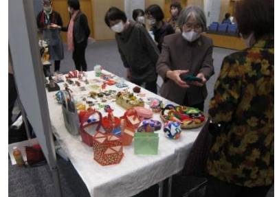
※写真は去年の様子です。※