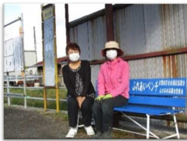
ふれあいベンチの設置 (みんなに優しいまちづくりのために)