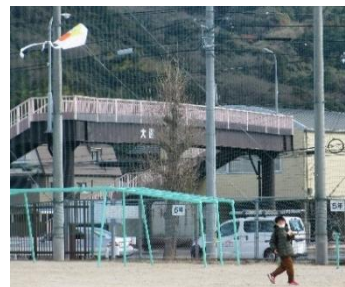
ふれあい交流 (昔遊びを楽しむ会 凧あげ)