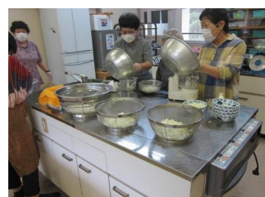
ボランティア活動 (ホウ酸団子造り)