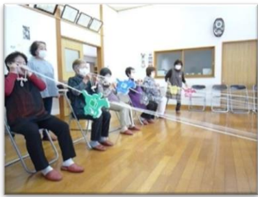
サロンへのゲーム器材貸出 (レクリエーション)

山口市では コロナ禍においても人々のあたたかなつながりを支える活動が展開されています