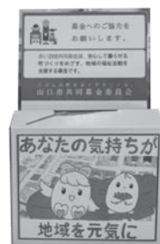
※第1回赤い羽根賞 受賞作品